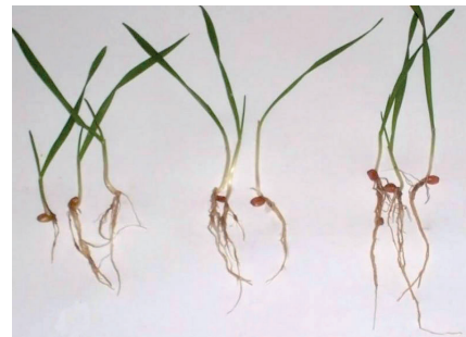
● Kontrola ● Fertigrain Start 1,0 l/t v % ● Fertigrain Start 1,5 l/t v %